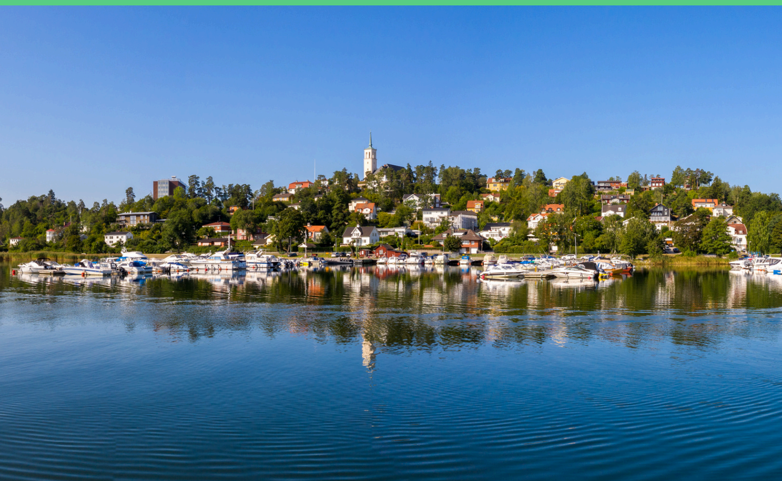
Bild 2. Edsviken, med Sankt Eriks kyrka på toppen av åsen och Sollentuna sjukhus skymtandes till vänster i bild.

“Vi vill att vår budget ska vara en budget för hela Sollentuna. En budget som möjliggör framtidstro och trygghet för alla oavsett var du bor.”