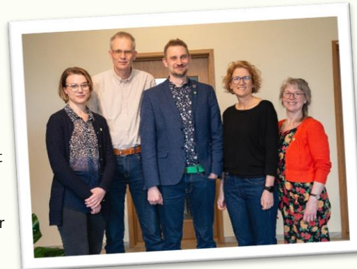
/Styrelsen för Miljöpartiet de Gröna Ekerö

Vi fortsätter att kämpa vidare för en rättvis framtid och vi lägger nu fram en budget med en massa gröna vinster! Läs mer om budgeten på vår facebookside!