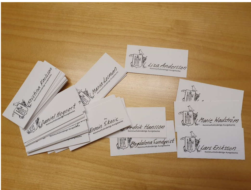
Bild. Alla ledamöter och ersättare i fullmäktige fick var sig visitkort av MP med ett nytt förslag på stadsvapen för att påminnas om att det finns fler arter än människan som bor i Kungälv, bland andra den tretåiga måsen, ålgräset och havsnejonögat.