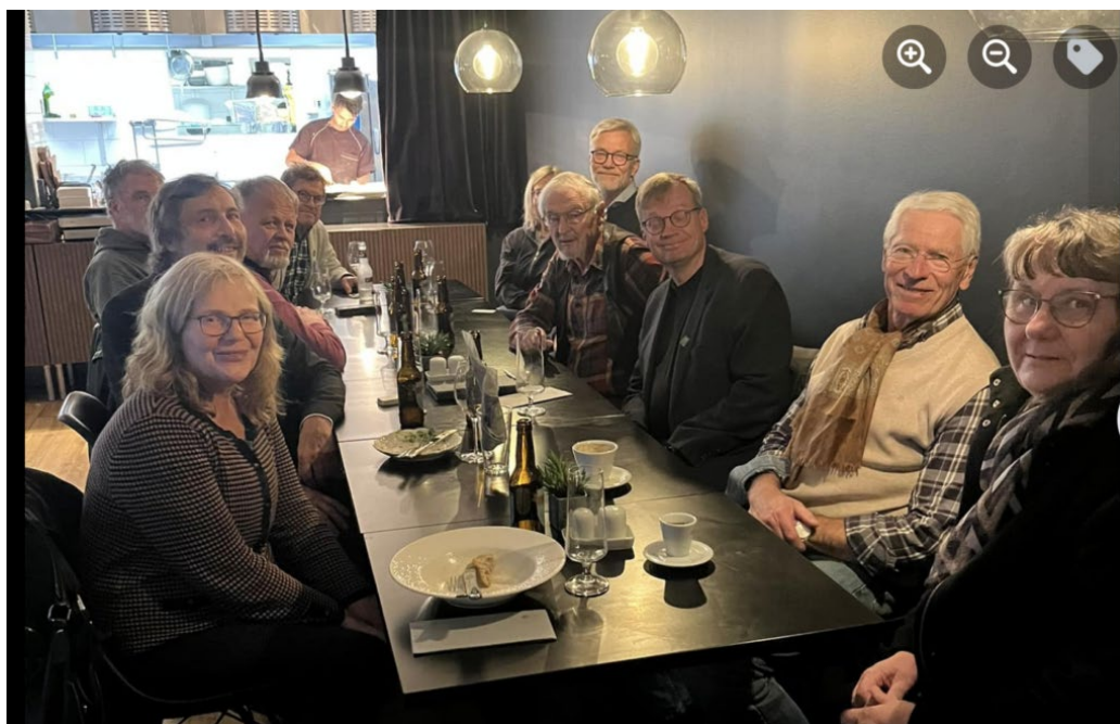
Bild från Grön-AW 9 November.

Till det ska läggas ett par After Work-torsdagar på restaurangen Rum 35 på Hotell Halland i Kungsbacka. Konceptet är informellt och enkelt: någon eller några miljöpartister med uppdrag i kommunen är på plats och sätter ett tema för de som vill veta mer eller diskutera någon specifik fråga. Datum för 2024 finns på mp.se/kungsbacka .