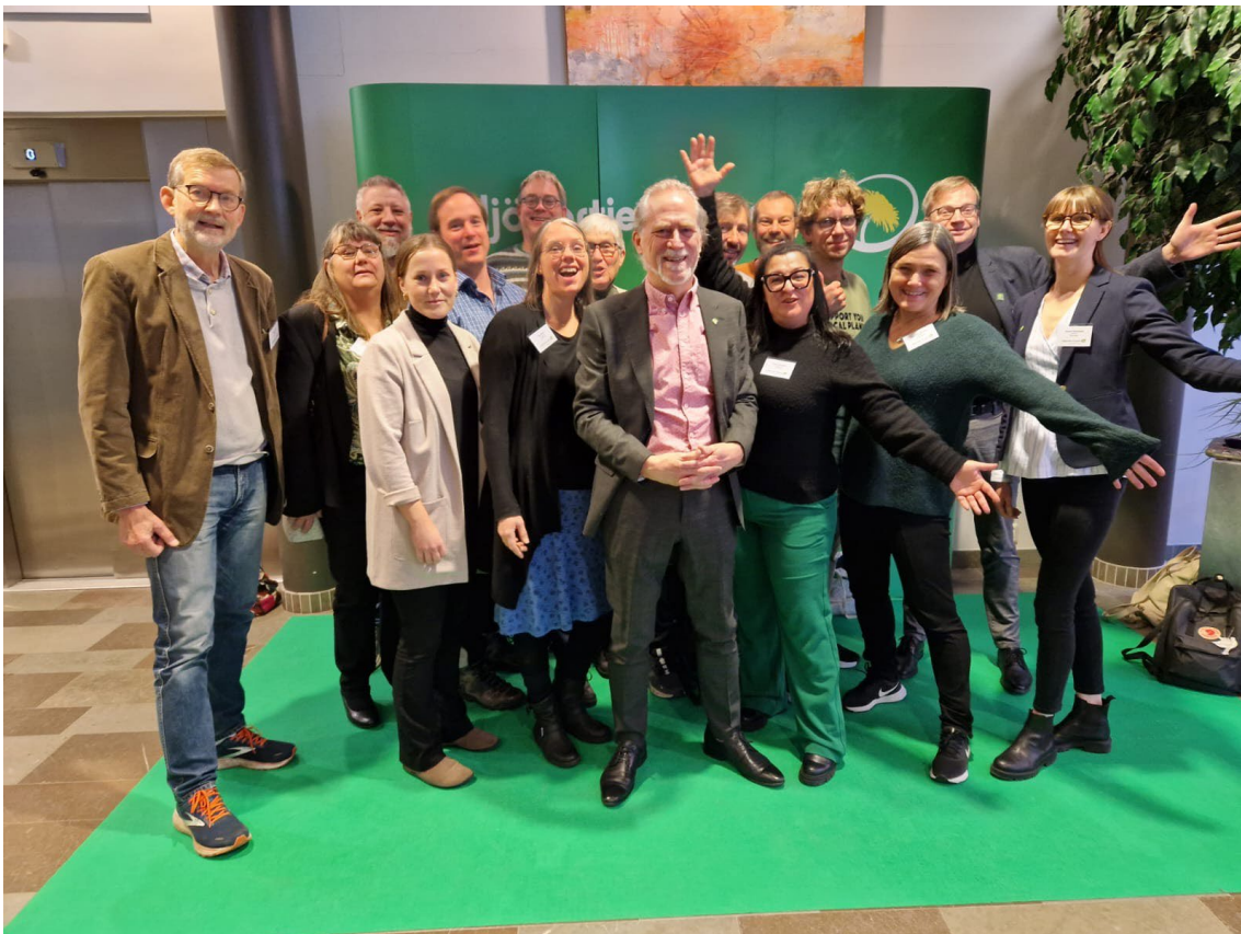
Bild från Miljöpartiets partikongress 17-19/11 i Örebro, efter att språkrören valts. Region Hallands MP-representanter + vårt nyvalda manliga språkrör Daniel Helldén

Vi valde också språkrör för Miljöpartiet, omval av kvinnligt språkrör, Märta Stenevi, och nytt manligt språkrör, Daniel Helldén.