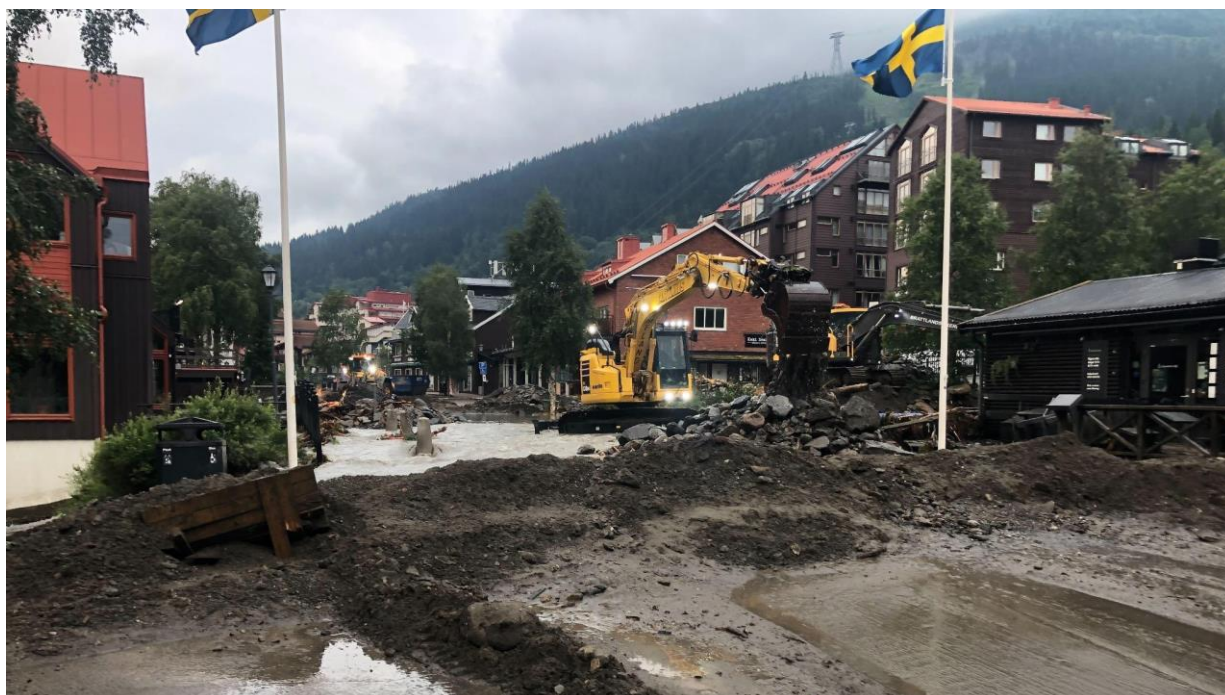
Bild 1. Stormen Hans drar in över Sverige och skapar förödelse i Åre.

Sollentuna kommun har satt mål om att bli Sveriges första kommun som inte "tär på jordens resurser" samt att vi behöver vidta "kraftfulla åtgärder" för att bidra till att den globala temperaturökningen inte överstiger 1,5 grader Celsius. Men vad innebär det i praktiken?